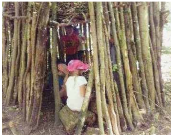
Eine eigene Hütte – da schlagen nicht nur Kinderherzen höher.