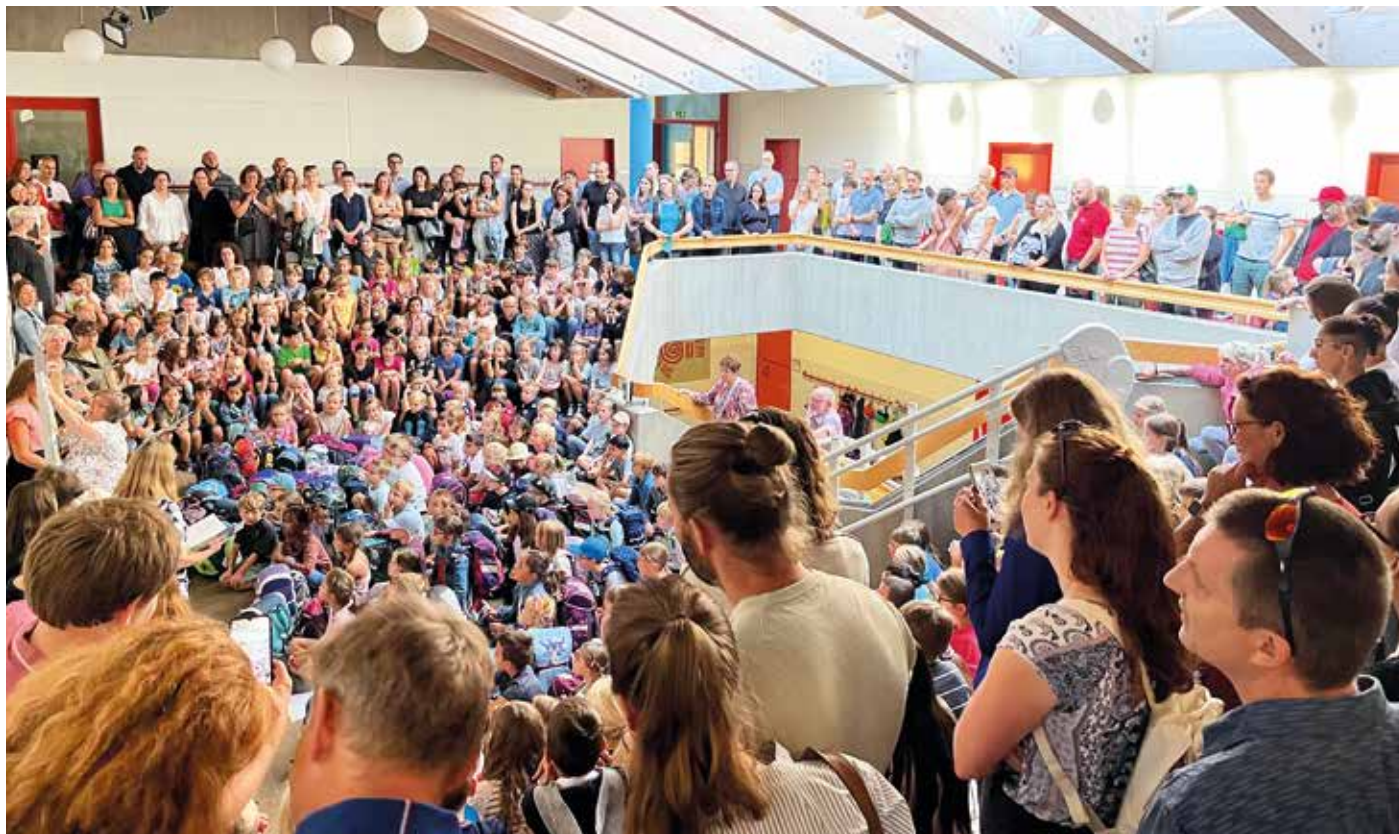
Feierstunde zur Begrüssung der neuen 1.-KlässlerInnen.

Es war ein ereignisreiches 2. Semester des Schuljahres 2021/22. Im März konnten wir endlich die Corona-Schutzmassnahmen aufheben. Das ganze 1. Semester und ein Teil des 2. Semesters waren stark geprägt durch das Virus. Es war belastend für unsere Schülerinnen und Schüler, unsere Mitarbeitenden an der Schule, die Eltern und auch für uns. Wir waren froh, dass wir wieder «normal» unterrichten konnten ab April 2022. Wir hatten auch endlich wieder Zeit für die für uns «wichtigen» Dinge.