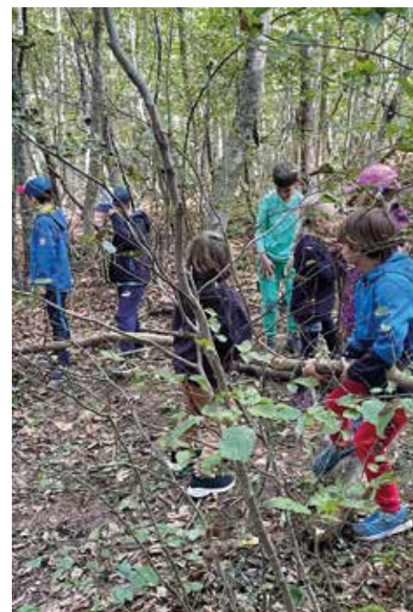
... zum Sporttag, der zum tollen Ereignis wurde.