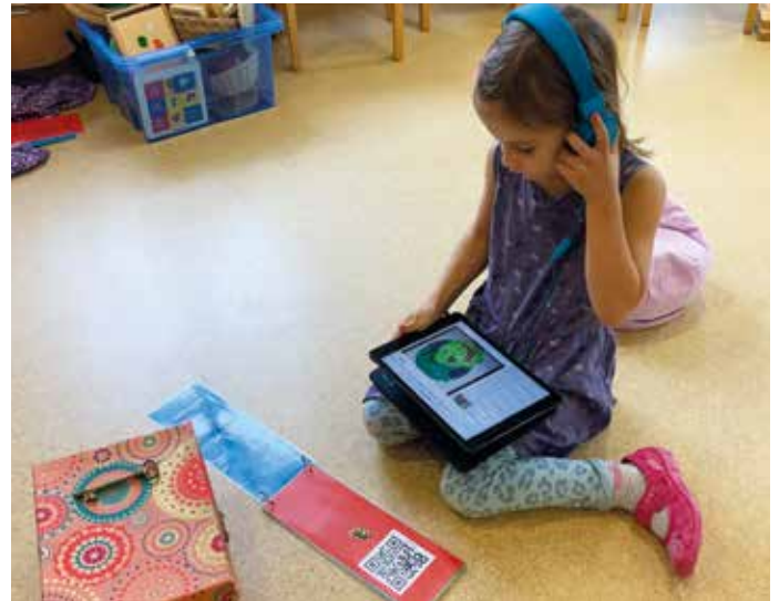
Wunderbar: Versunken im Sprachenschatz der eigenen Klasse.

lekt zum Grüssen bringen. Von den fertigen Videos wurden Barcodes erstellt und das Kind durfte diesen auf seinen Papierstreifen kleben. Alle Streifen wurden zu einem mehrsprachigen Begrüssungsfächer zusammengeheftet, welcher seinen Platz in der Sprachenschatzkiste fand. Dieser steht den Kindern nun, wann immer sie sich damit beschäftigen mögen, zur Verfügung. Die Schulkinder wissen, wie die Barcodes mit den Tablets gelesen werden und sie können damit die Begrüssungen in den verschiedenen Sprachen immer wieder hören und nachsprechen.