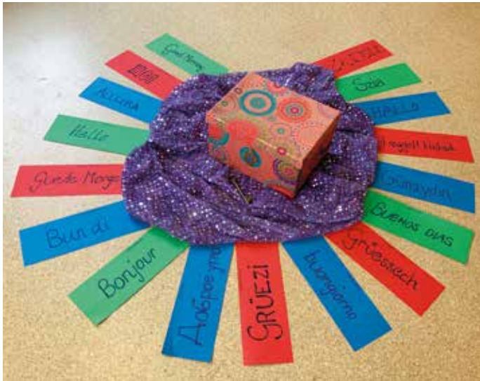
Mit Begrüssung beschriftete Papierstreifen.