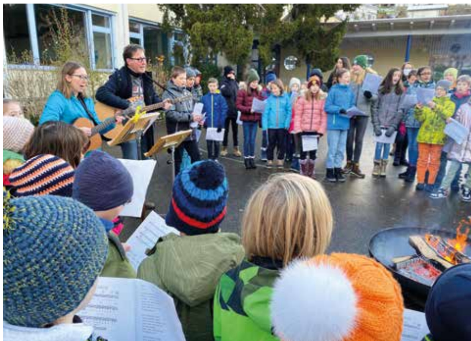
Kinder singen im Advent.

Das erste Semester des Schuljahres 2021/22 ist passé. Es war ein ereignisreiches Semester. Corona hat uns einen Strich durch einige unserer Rechnungen gemacht, aber nicht durch alle. Wir konnten ein paar sehr schöne Anlässe durchführen. Im ersten Quintal, im September, führten wir die beiden Sport-