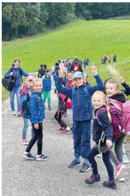
Bei prächtigem Wetter auf in den Wald ...