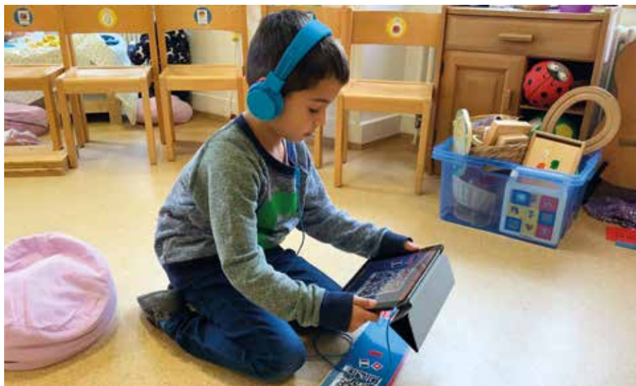
Konzentriert bei der Arbeit mit dem Begrüssungsfächer.

In den nächsten Tagen zeichneten die Kinder ein Selbstporträt und durften dieses mit Hilfe von Chatterpix – einer App – in ihrer gewählten Sprache, ihrem gewählten Dia-